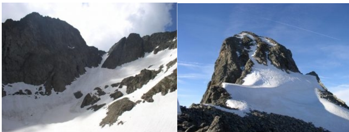
Canale e Cima della Maledia