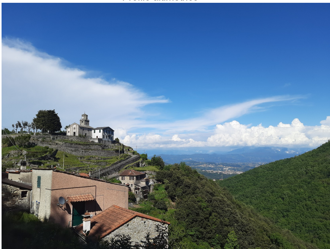
il Borgo di Carpegna con la vista verso le Apuane