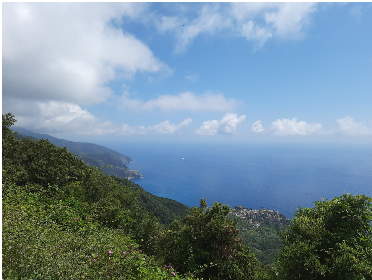
Vista su Corniglia da Case Fornacchi