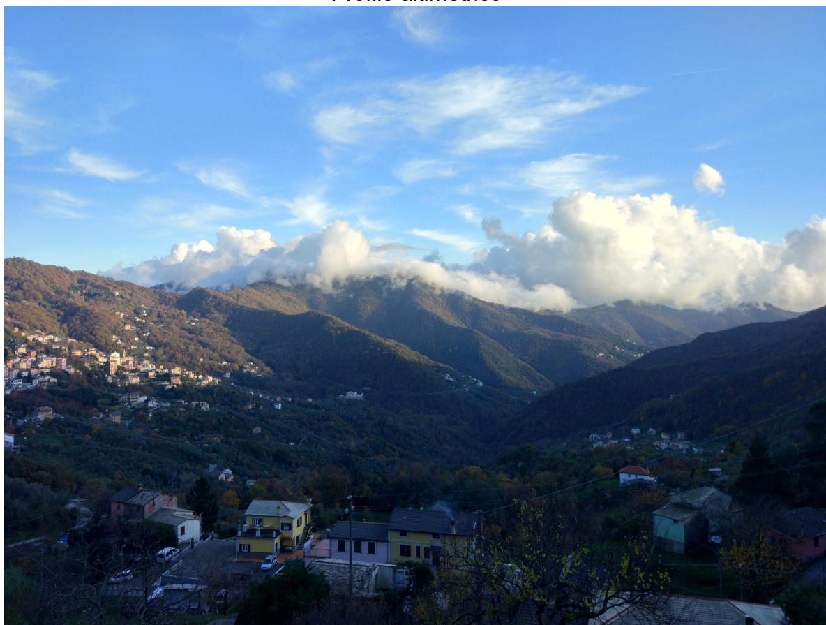
Calcinara – vista verso Uscio