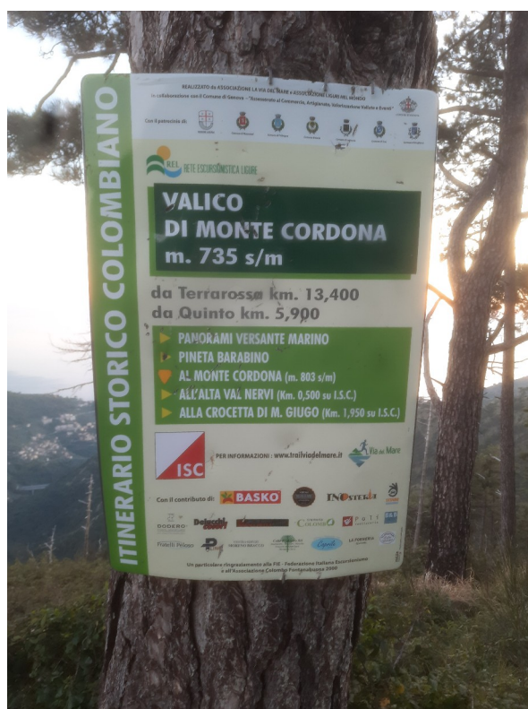
Cartellonistica tipo e segnavia