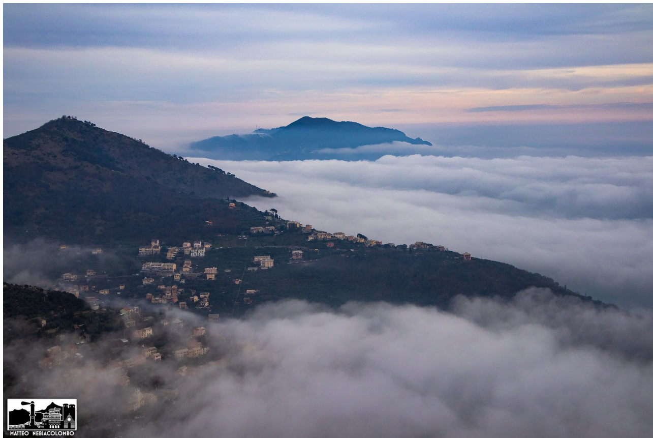
Monte Giugo – Mare di nuvole e monte di Portofino