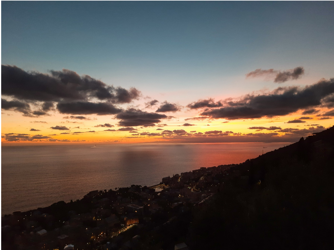
Tramonto a S. Ilario