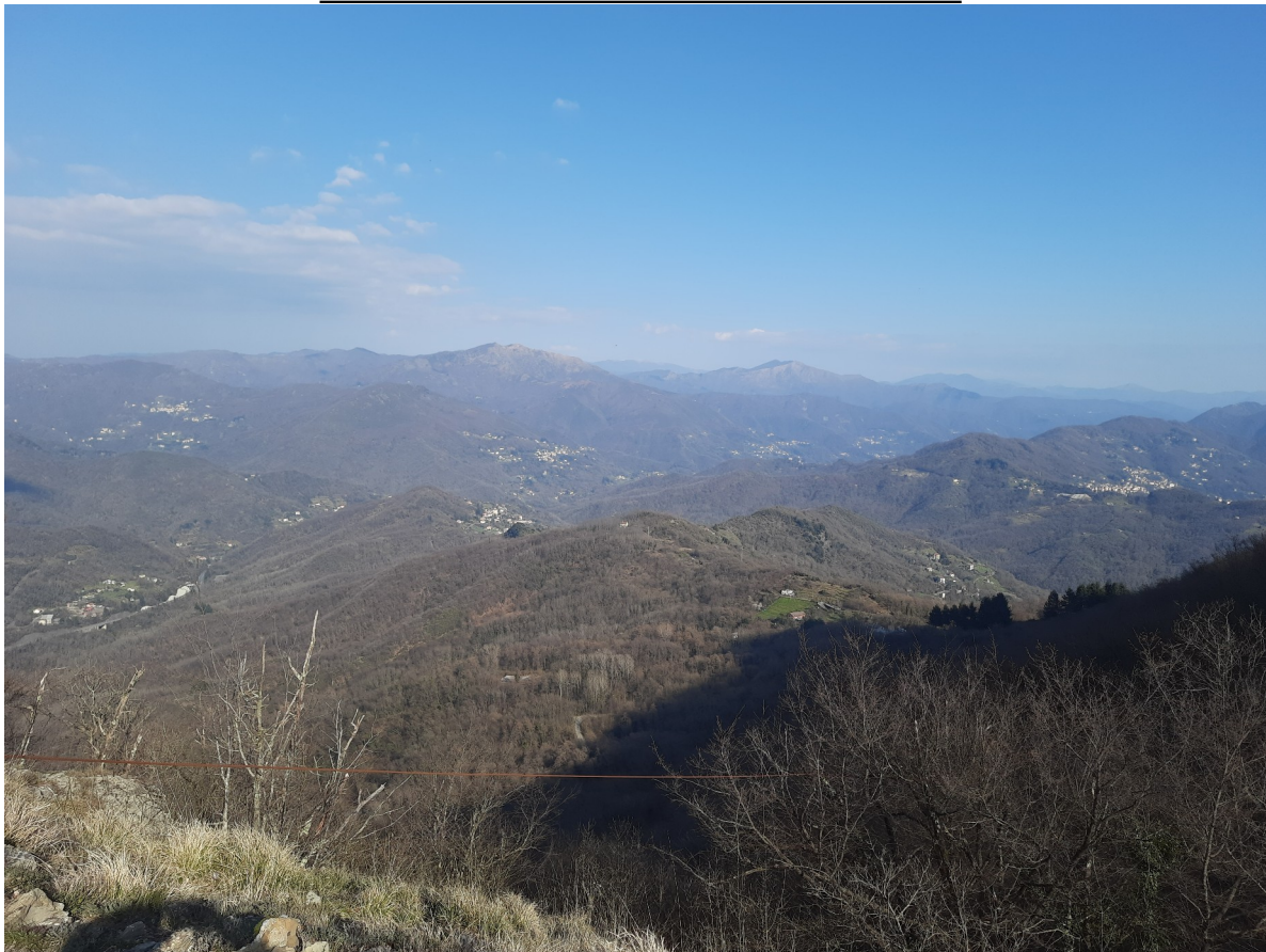
Vista su Uscio da Calcinara