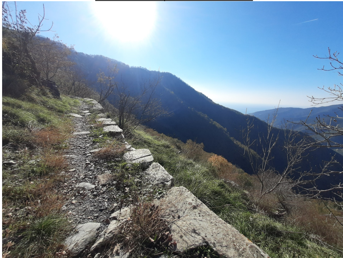
Vista sulla vallata di Recco