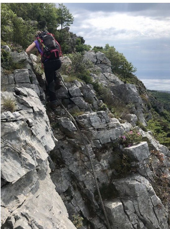
Paretina "difficile" in uscita